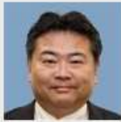
れいわ | 元 たかい たかし 高井 崇志