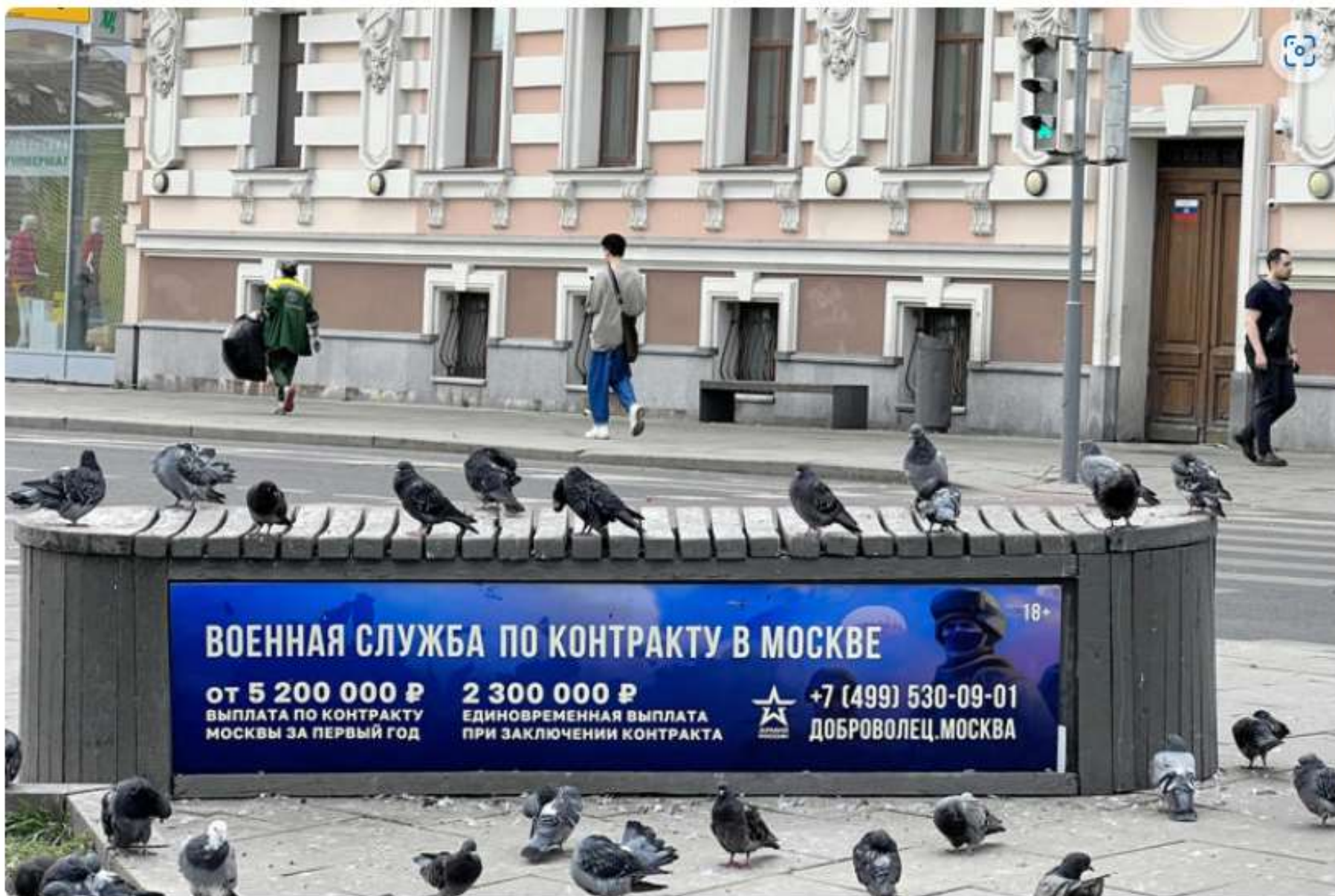
2024年9月13日 モスクワ市内で朝日新聞の記者が撮影 契約兵を募集する広告 1年目のモスクワの契約兵への支払いは520万ルーブルから と書かれている 230万ルーブルは契約締結時の一時金 右下はボランティアモスクワとなっている