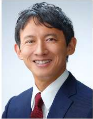
日本維新の会 小野 たいすけ