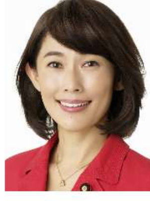
自由民主党 丸川 珠代