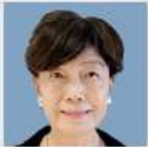
国民 | 新 まどか よりこ 円 より子