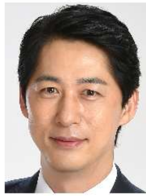
立憲民主党 松尾 あきひろ