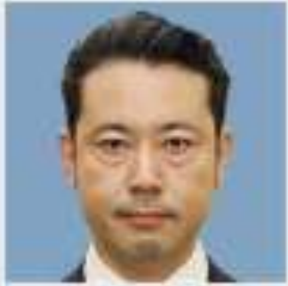
自民 | 前 おおつか たく 大塚 拓