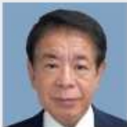
無 | 前 しもむら はくぶん 下村 博文