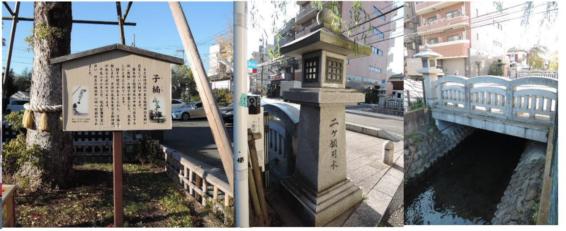
二ヶ領用水に架かる橋

二ヶ領用水が大山街道と交差する所。現在は親水公園のようになっていて柳の並木もある。