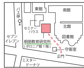
〔桐朋学園女子部門〕